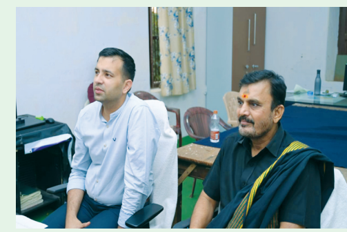
ప్రభుత్వం డెజ్ చార్జీల పెంచినందున డిసెంబర్ 14న అన్ని కేంద్రాల్లో కొత్త మెనుతో భోజనాన్ని ప్రారంభించాలని మంత్రి తెలిపారు. ఈ మీడియా కాన్ఫరెన్స్ లో పరిగి తపసిల్దార్ కార్యాలయం నుండి గిరిజన సుకేష్ శాఖ