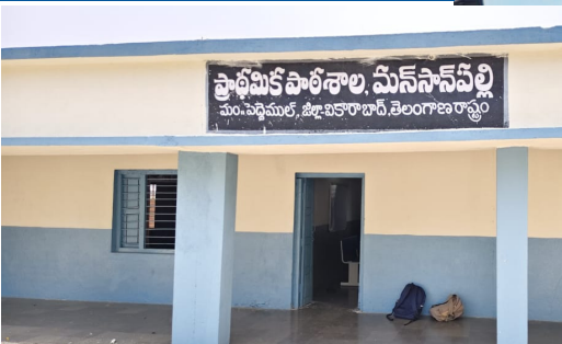
వారికి బోధించడానికి ఒక అంగన్వాడీ టీచర్ ఉన్నారని విద్యార్థులు త్రాగునీటి కోసం ఇబ్బందులు పడుతున్న పరిస్థితిని గమనించిన పాఠశాల ఉపాధ్యాయులు స్థానిక సర్పంచ్ కు, గ్రామ పంచాయతీ సిబ్బందికి సమాచారం అందించారు. అందుకు

పెద్దముల్ సీపాత ఎక్స్ ప్రెస్: వికారాబాద్ జిల్లా తాండూరు నియోజకవర్గం పెద్దముల్ మండల పరిధిలోని మన్ సాన్ పల్లి ప్రాథమిక పాఠశాలలో త్రాగునీటి సమస్య తీవ్రంగా మారింది. పాఠశాలలో ఉన్న బోరుబావిలో నీరు పూర్తిగా అడుగంటిపోవడంతో విద్యార్థులు త్రాగునీటి కోసం నానా ఇబ్బందులు పడుతున్నారు.గత రెండు మూడు రోజులుగా త్రాగునీటి సమస్య విద్యార్థులను తీవ్రంగా వేధిస్తోంది సమాచారం ఇదిలా ఉంటే ఒకే ప్రాంగణంలో ప్రాథమిక పాఠశాల, అంగన్ వాడీ కేంద్రం ఉండగా ప్రాథమిక పాఠశాలలో మొత్తం 27 మంది విద్యార్థులు అందులో పాఠశాల 12 మంది, బాలికలు 15 మంది, వారికి బోధించడానికి ఇద్దరు మహిళా ఉపాధ్యాయులు, అంగన్ వాడీ కేంద్రంలో మొత్తం 12 మంది చిన్నారులు ఉండగా